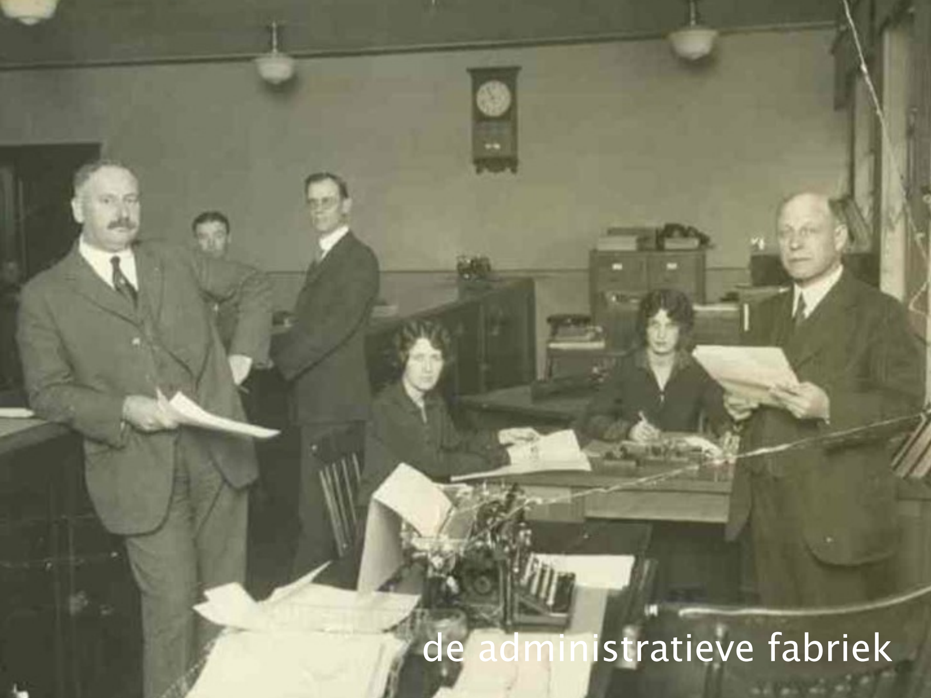
de administratieve fabriek